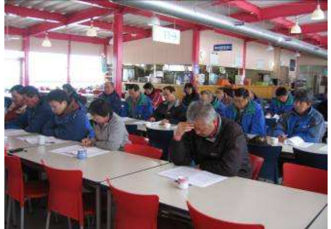
2011 シーズン前リフト救助訓練 (2010.12.18)