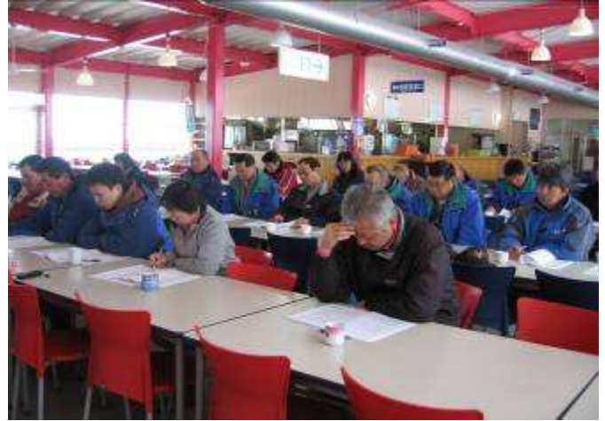
2011 シーズン前リフト救助訓練 (2010.12.18)