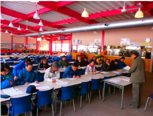
(安全講習会の様子)

シーズン前の安全教育だけに留まらず、シーズン中もスキースクールスタッフと合同で救助訓練を実施します。