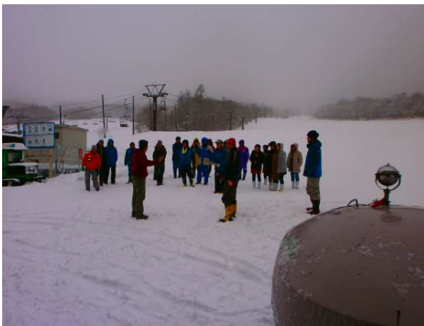
(避難訓練終了の様子)