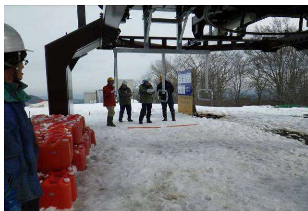
(クワッドリフト完成検査)