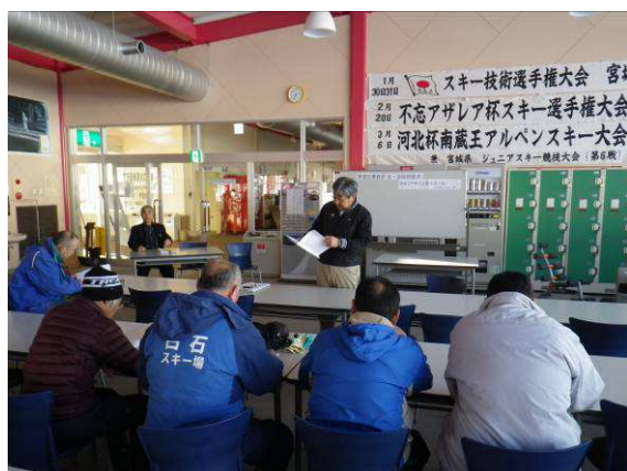
(安全講習会の様子)